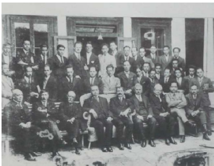
Profesores y estudiantes de la Escuela de derecho 1926