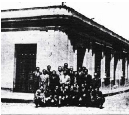
Escuela de Ciencias Jurídicas y Sociales en 1922

La Escuela de Ciencias Jurídicas y Sociales de Occidente, que estuvo instalada en la 1ª. calle, entre 13 y 14 avenida de la zona 1 de Quezaltenango, o sea en el edificio contiguo a la actual Librería Evangélica. Funcionó en este lugar 9 años.