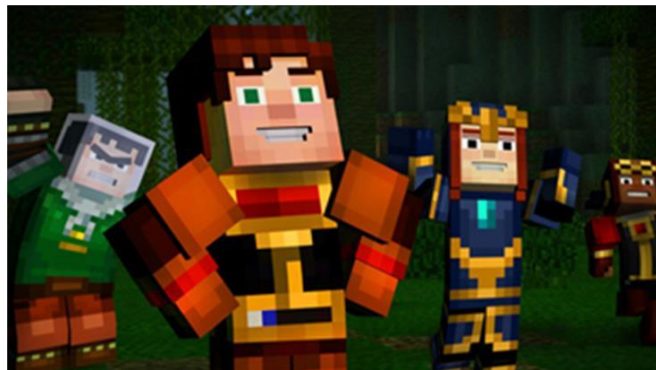
Modo historia de “Minecraft”