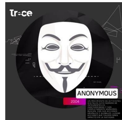
Canal Trece Colombia

Su ideología no está definida, pero a lo largo de su historia se han manifestado por la libertad de expresión, la libertad de compartir información, asuntos sociales y políticos, y la independencia en Internet. Desde el año 2008, cambiaron su rumbo para manifestarse en la red a favor de la libertad de expresión, de la independencia en Internet y en contra de las acciones autoritarias de los gobiernos, entre otras causas, aunque no siempre de forma legal. Anonymous nació como diversión en el año 2003 en los foros de 4Chan. Una comunidad donde cualquier usuario puede publicar un texto o una foto relacionada con un tema. Claro que este blog siempre cuenta con enfoques buenos y malos, por ello es necesario asegurarse en qué contexto utilizamos el 4Chan si decidimos hacerlo. Contrario a Facebook, no necesitas identificarte para dejar un comentario. Por ello el usuario aparece como “Anonymous”.