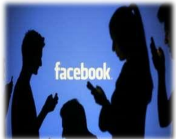
(El Nacional 2020)

En esta tercera parte consideramos necesario explicar de forma más detallada porqué las personas deberían de usar Facebook, aunque en la segunda parte se explica un poco sobre sus ventajas y desventajas, en esta tercera parte desarrollaremos los beneficios principales del uso de esta red social, que facilita la interacción masiva entre sus usuarios en diversos ámbitos.