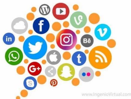
(Tipos de redes sociales. s.f.)

¿Sabemos realmente qué riesgos suponen las redes sociales? Para empezar, es importante entender qué es una red social. Estas son plataformas digitales formadas por comunidades de individuos con intereses o relaciones en común, ya sean de amistad, parentesco o por trabajo, permiten el contacto entre varias personas y funcionan como